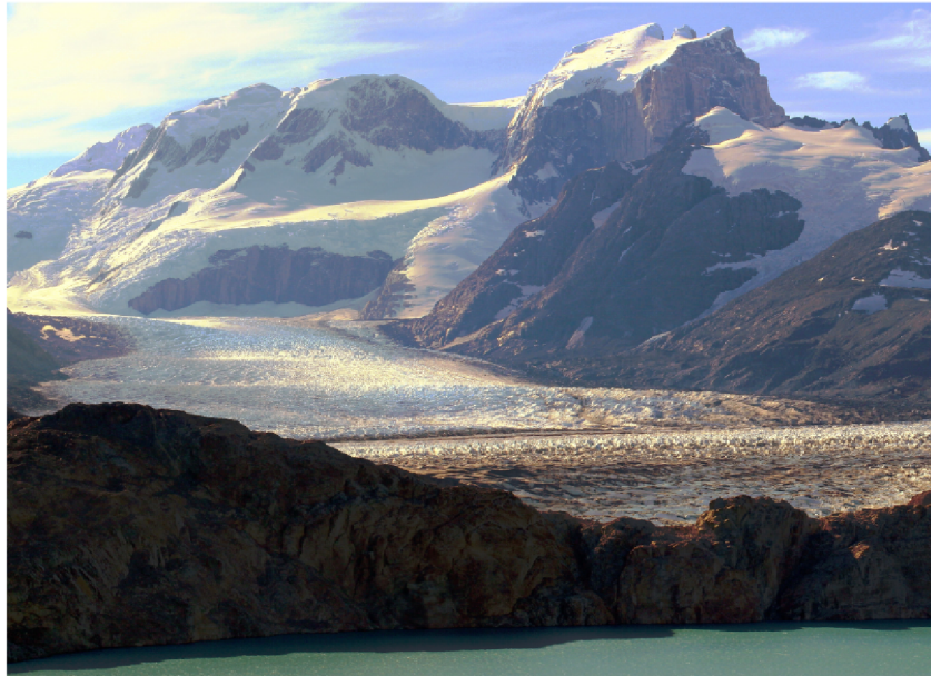
Cerro Murallón y glaciar Cono